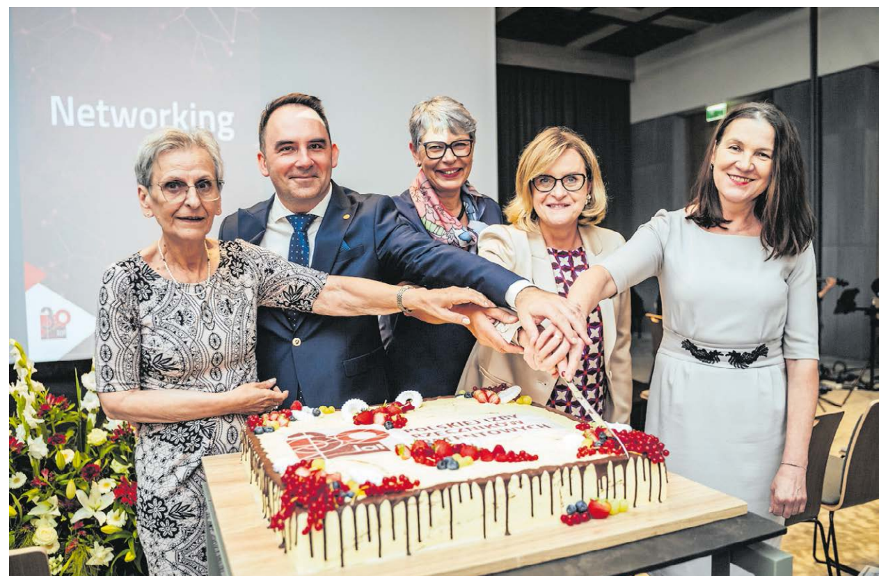
Uroczyste obchody Dnia Rzecznika Patentowego w Pałacu Branickich w Warszawie.

PIRP współpracuje z biurami karier szkół wyższych oraz prowadzi spotkania w szkołach średnich o profilu technicznym, ponieważ już tam można spotkać przyszłych przedsiębiorców i twórców innowacyjnych rozwiązań. Chcemy, aby zarówno studenci, jak i uczniowie wiedzieli więcej o prawach własności przemysłowej, nauczyli się, jak z nich korzystać, i dowiedzieli się o roli rzecznika patentowego. Dla wielu młodych ludzi te spotkania to także impuls do podjęcia decyzji o wyborze zawodu rzecznika patentowego jako ścieżki zawodowego rozwoju. Corocznie organizujemy wydarzenia z okazji Światowego Tygodnia Własności Intelektualnej, a także zapraszamy na darmowe webinary edukacyjne podczas takich wydarzeń jak Tydzień