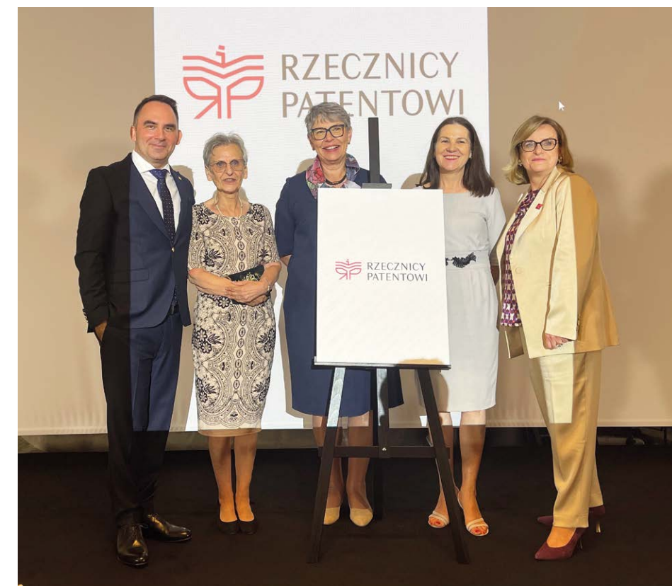
Nowe oznaczenie RZECZNICZY PATENTOWI gwarantem jakości, wiedzy i kompetencji w sprawach własności intelektualnej.