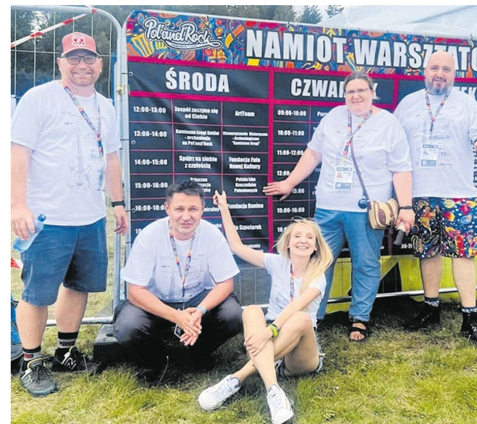
Rzecznicy patentowi reprezentujący PIRP jako prelegenci Akademii Sztuk Przepięknych na Pol'and'Rock Festivalu.

Coroczną tradycją stały się także Dni Otwartych Kancelarii Patentowych, podczas których rzecznicy patentowi udzielali bezpłatnych konsultacji prawnych.