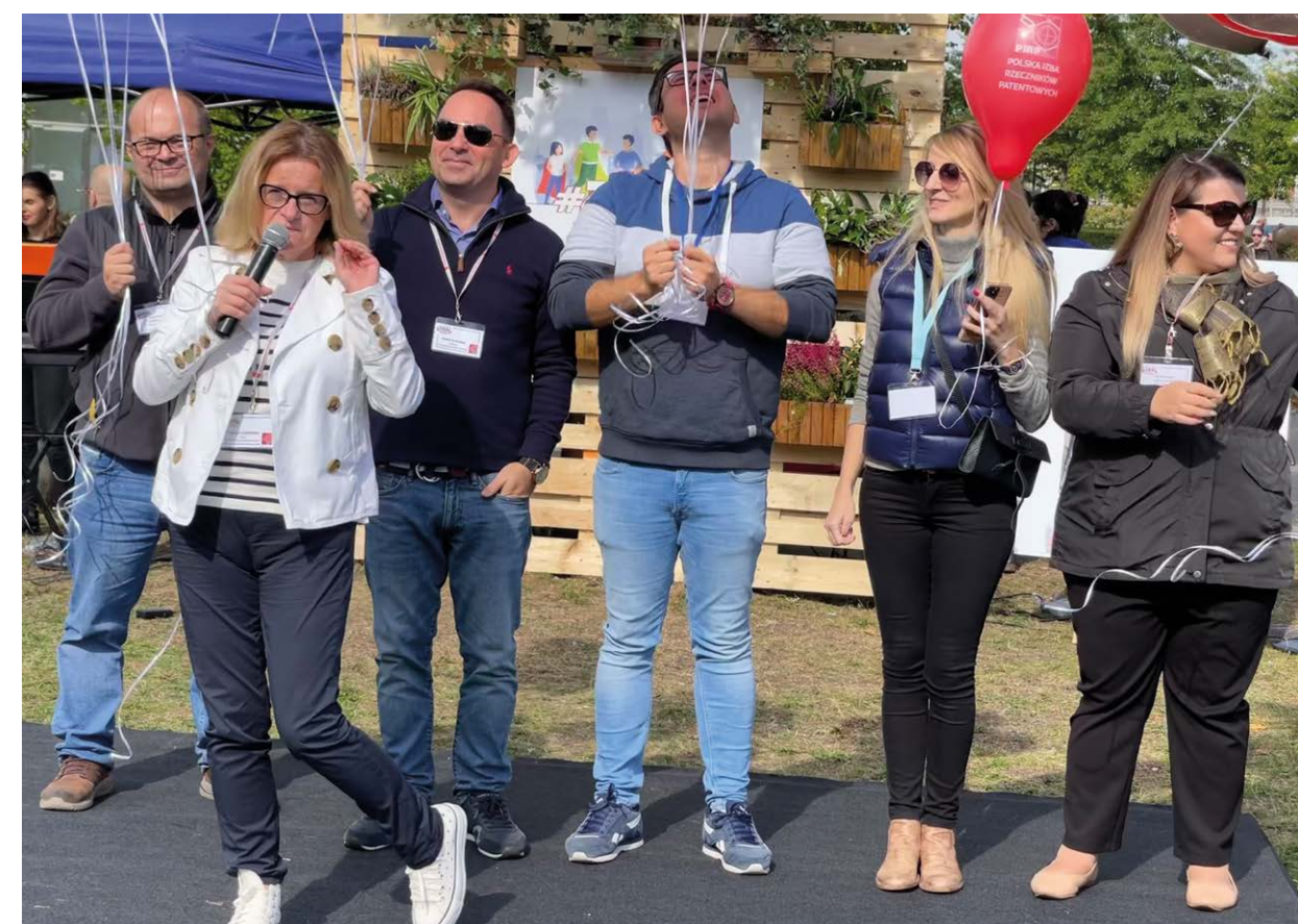
Piknik OPSZZP 2022.