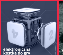
elektroniczna kostka do gry